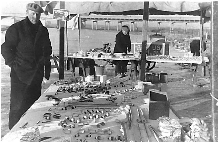
Afb. 3. Kraam met voornamelijk lange Gouwenars en krulpijpen. Aan de paal hangt een winkelkaart waarop 'Goedewaagen's Pijpen' uit 1929. (SAHM 4448)

Bij de ingang naar de stad hadden handelaren hun kramen met typische Goudse producten opgezet om de binnenkomende en vertrekkende schaatsers te verleiden tot aankopen: 'Wie hunner niet aan den ingang der