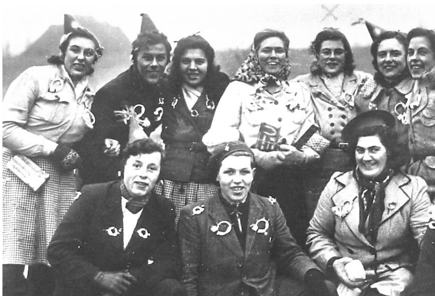
Afb. 1. Schaatsters en schaatsters uit Berkel na het volbrengen van de pijpentocht te Gouda, 1946-1947.

Op zondag 10 februari 1929 stond er een matige wind uit het oost-zuid-oosten. Het was een droge dag. De gemiddelde temperatuur bedroeg -5,1 °C en er was een gevoelstemperatuur van -12,8 °C. De zon scheen die dag 1,6 uur. Een prima dag voor een schaatstochtje vonden velen. Een mooie dag om naar Gouda te schaatsen en pijpjes, spritsen en stroopwafels op te halen!