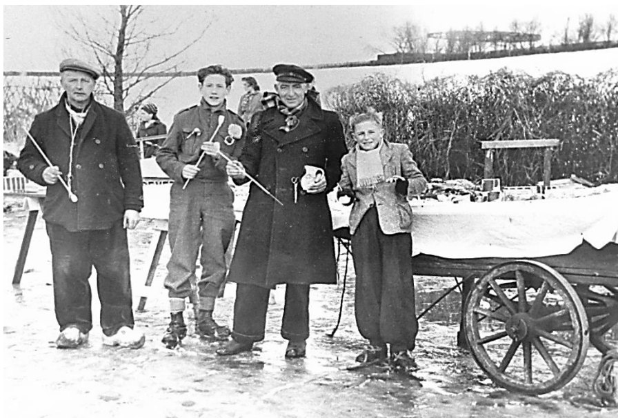
Afb. 2. Schaatsers en handelaar bij ijskraam te Gouda, circa 1925-1940.

Ze zijn gekomen: de schaatsenrijders van heinde en verre om het traditioneele bezoek aan de Pijpenstad te brengen. Uit de Krimpenerwaard en uit de Rijnstreek kwamen ze al eerder, uit de nabijgelegen plaatsen Boskoop, Waddinxveen, Reeuwijk, Bodegraven en Zevenhuizen is het naar Gouda maar een tripje, een genoegelijk tochtje fluks op en neer. Maar nu zijn ook de Rotterdammers gekomen. In lange slierten en twee aan twee zijn ze vanuit Rotterdam komen zwieren, rits-rats, rits-rats, tot het eindpunt van den tocht, de Lazaruskade bij de Wachtelstraat was bereikt, waar de kramers met